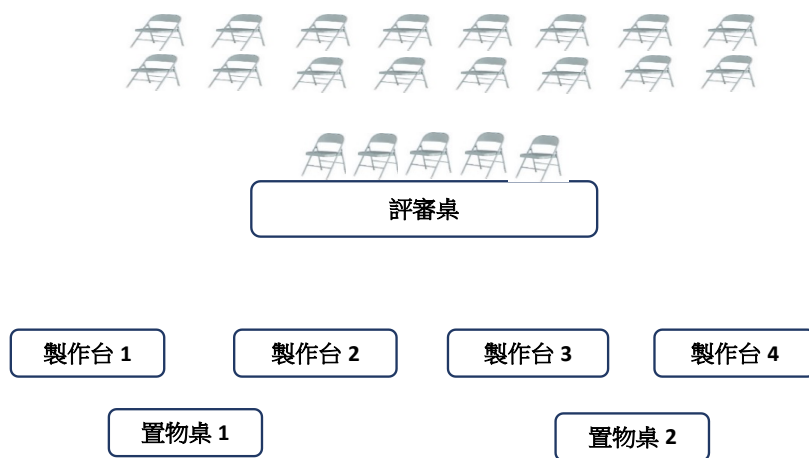
圖 2-評選區配置示意參考圖